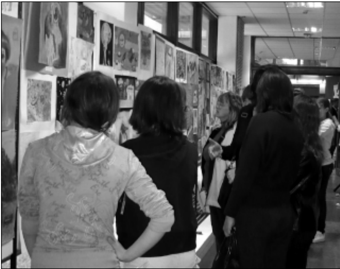
A meghirdetett pályázatra több mint 180 alkotás érkezett be

lyázatát. Az eredményhirdetésre szerdán került sor a Madách Imre Művelődési Központ aulájában.