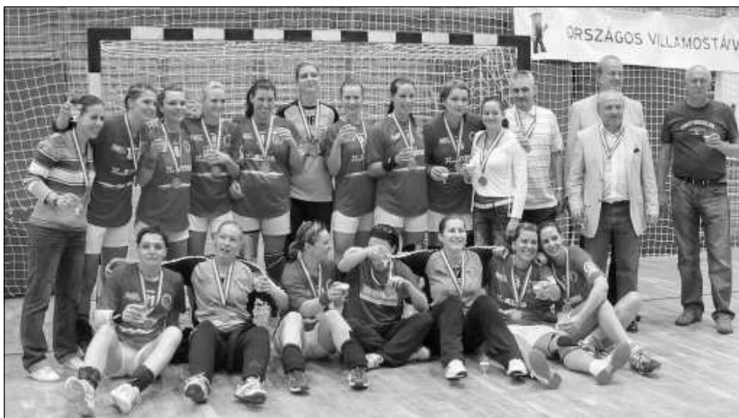
Az ünneplő csapat és a vezetők. Jövőre folytatják - ígérték

Telt ház előtt megszerezte a bajnoki bronzot a Váci NKSE