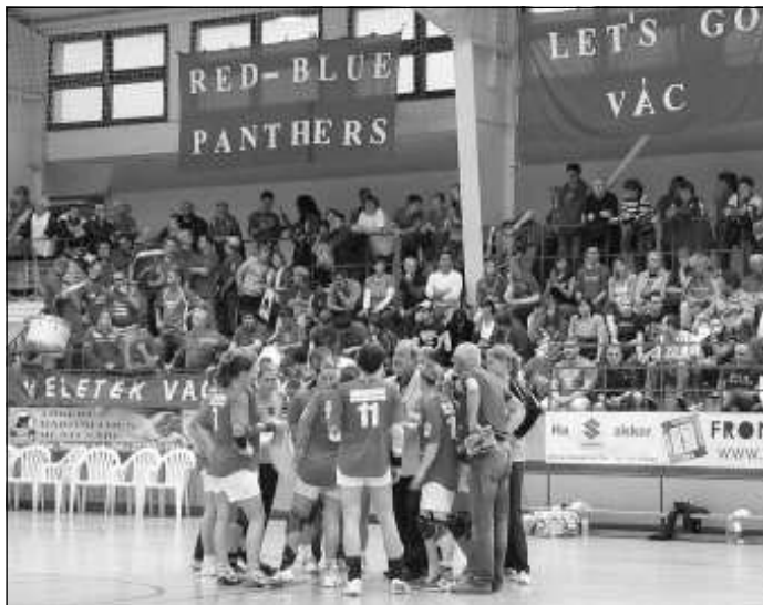
Időkérés egy nehéz pillanatban. De a szurkolók nem tágítottak: veletek vagyunk! - írták, mondták

És jött a bronzcsata a Békéscsaba ellen. Az első meccs Vá-