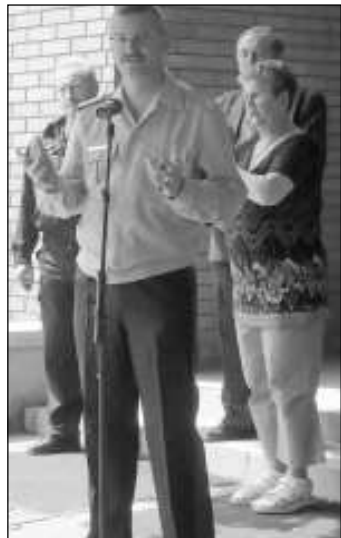
Bozsó Zoltán dandártábornok

ákokat. A fiatalok megnézhettek akár egy rendőrautót, tűzoltóautót és mentőautót belülről, vagy megismerkedhettek a thai művészetével.