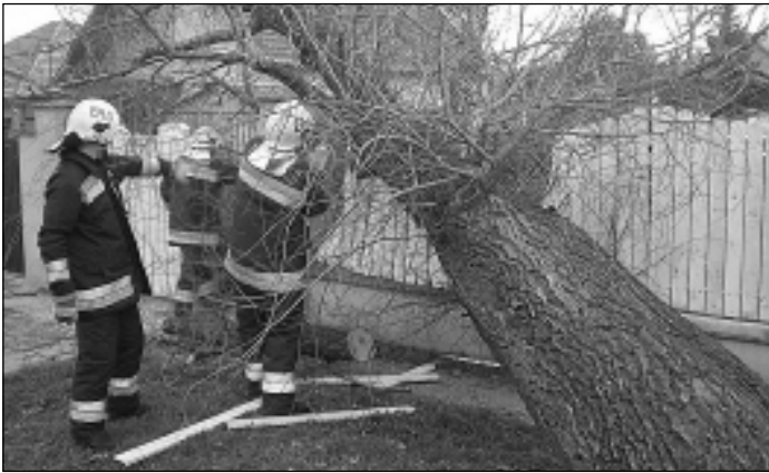
Fát darabolnak a tűzoltók. Milliók károkat okoztak

A május eleji meleg, az igazi tavasz már csak emlék. A vasárnap óta fújó szél és hulló eső súlyos károkat okozott országszerte. Az origo.hu tudósítása szerint több napos esőzés és viharos