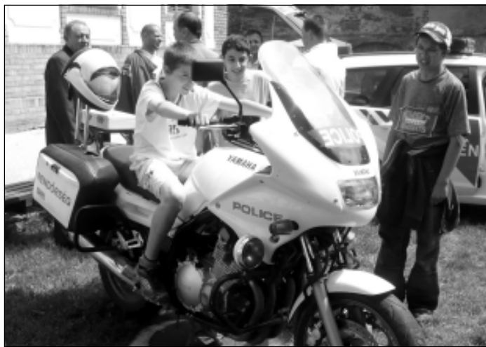
A gyerekek kipróbálhatták a rendőr motort és autót

ákokat. A fiatalok megnézhettek akár egy rendőrautót, tűzoltóautót és mentőautót belülről, vagy megismerkedhettek a thai művészetével.