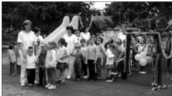
A gyerekek alig várták, hogy birtokba vegyék a felújított udvart