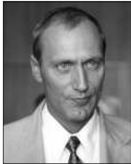
Székely Tamás miniszter. Tapsot és petíciót is kapott

Úgy fogalmaztak: a kórházstruktúra minden elemében megroppant. Megszüntették az anyatejgyűjtő állomást és a koraszülöttszályt, pri-