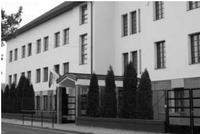
A TISZK. Vissza nem térítendő támogatást kaptak az Új Magyarország Fejlesztési Tervtől

A program kötelezően megvalósítandó tevékenységei között szerepel többek között a hátrányos helyzetű, az oktatási rendszerből lemorzsolódók szakképzésbe történő bevonása és munkavállalói kompetenciáik fejlesztése mellett az önálló tanulásra alkalmas, kompeten-