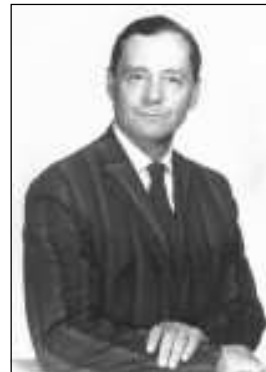
Wass Albert. Versei, könyvei népszerűbbek, mint valaha