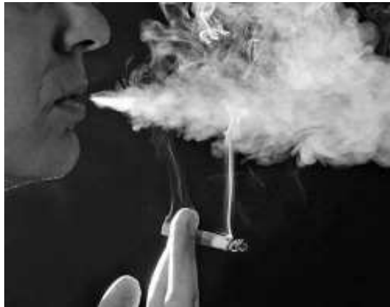
A dohányosok relatív stroke-rizikója kétszeres

Alkohol. Több, gyakran ellentmondó közleményből levonható és ma már elfogadottnak tekinthető végső következtetés szerint az alkoholfogyasztás és a stroke között meghatározható összefüggés alapján az enyhe, illetve mérsékelt (maximum: bor 240 ml/nap, sör 720 ml/nap, tömény 90 ml/nap) és megfelelő minőségű alkohol fogyasztása fajtától és nemtől függetlenül némi- leg csökkenti a stroke ri-