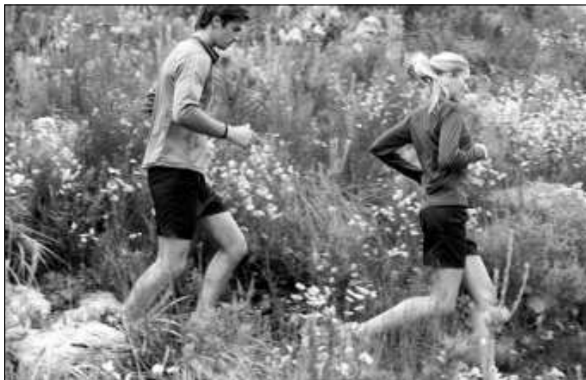
A sportolásra a legnagyobb veszélyt a számítógépek, játékkonzolok elterjedése jelenti

Nemzetközi viszonylatban - 6 nyugat-európai és 3 régiós ország adatait vizsgálva - a magyar 13 évesnél idősebb városi