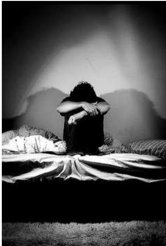
Sok embernek pontos elképzelése van arról, hogy miért lett depressziós

Biológia. Sok új dolgot kell még felfedeznünk addig, míg pontosan érteni fogjuk, hogy miért lesznek az emberek depressziósak. Sok adat van azonban már most, ami arra utal, hogy a betegség nem más, mint néhány anyag egyensúlyának felborulása az agyban. Ezeket az anyagokat neurotranszmittereknek nevezik. Az antidepresszáns gyógyszerek ezeknek az anyagoknak az egyensúlyát próbálják visszaállítani.