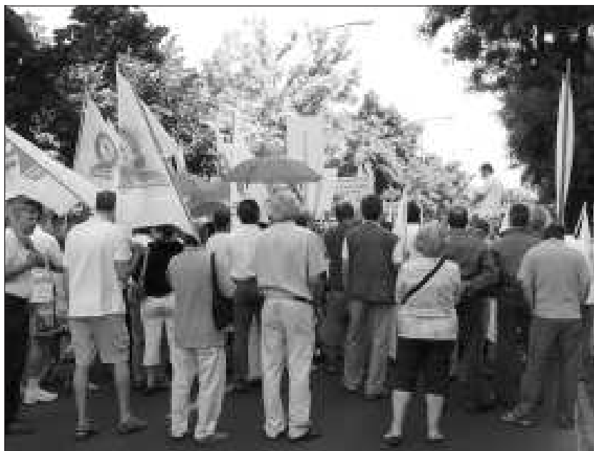
Az emberek féltik munkahelyeiket és a vízdíjak drágulásától tartanak

Mintegy négyszázan demonstráltak a váci székhelyű Duna Menti Regionális Vízmű Zrt dolgozói közül szombaton délelőtt a Nemzeti Vagyonkezelő budapesti székháza előtt. A résztvevők az ellen tiltakoztak, hogy a Nemzeti Vagyongazdálkodási Tanács április elején a cég kettéosztásáról döntött, a megmaradt rész eddig állami tulajdonú üzlet-résztét pedig a kazincbarcikai vízmű kezelésébe kívánják adni. A demonstrálók petíciót adtak át az MNV Zrt képviselőjének.