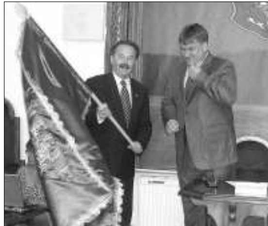
A polgármester meglengeti a megyei elnöktől átvett zászlót

- a Jávorszky Ödön Kórház labormunkálatait végző cég ellenfelszámolási eljárás van folyamat-