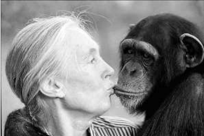
Jane Goodall egyik leghíresebb fotója. Nemrég Budapesten járt a világhírű környezetvédő

A jelenlévő nyertesek közül kategóriánként (fotó, irodalmi