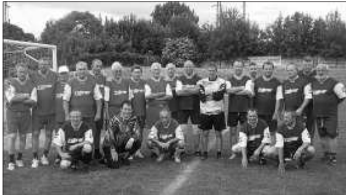
A résztvevők két csapatot alkotva megmérkőztek egymással

it, ezért semmiben nem szenvedtek hiányt. Kezdetben a váci állomás mellett lévő gödörben volt a sportpályájuk. Ez mindenkinek nagyon emlékezetes idő volt, többek között azért is, mert fekete salakkal volt megszórva a játéktér. A pálya bezárását követően költöztek a ma Reménység pályaként ismert területre, amely füves pálya volt. Itt a felnőtt csapat mellett az ifjúsági mérkőzéseken is két-három ezer néző szurkolt a csapatnak. A szép emlékek, abból az időből ilyen alkalmakkor előjönnek és ezért is szerveznek legalább öt évenként találkozókat.