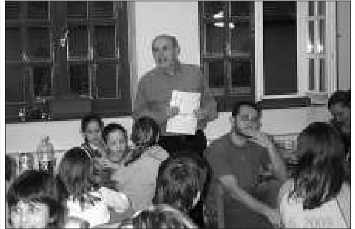
Közgyűlés az úszóknál. Új elnököt választottak