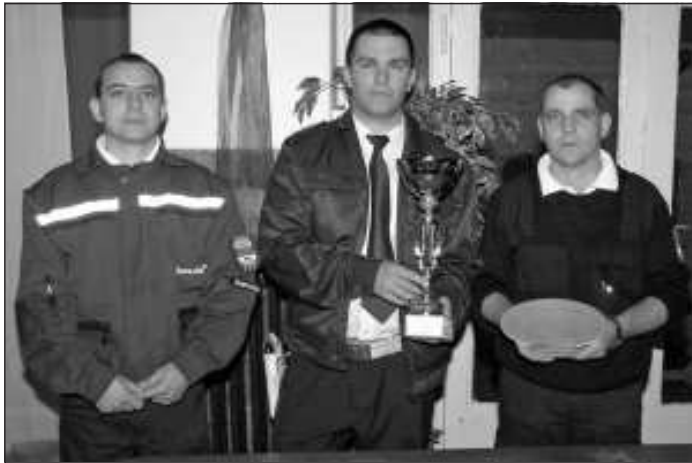
A 14 csapat közül a legeredményesebb Vác város Zsaru-Car csapata lett

A 14 csapat közül a legeredményesebb Vác város Zsaru-Car csapata lett, immáron 24. alkalommal állha-