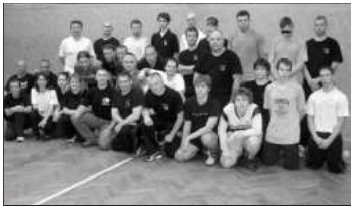
A P1-es szintű vizsga minden vizsgázónak sikerült. A képzés folytatódik

A legtöbb gyakorló nem a felvarróért vagy a szintek haj-