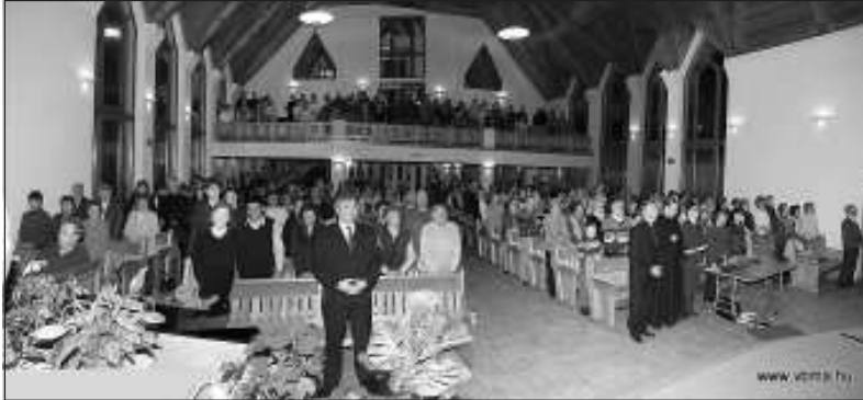
Ökumenikus Istentisztelet a váci baptista imaházban

feltámadását ünnepeljük! A feltámadás nélkül teljesen feleslegessé válna a hitünk, a templomba járásunk, az imádságunk, minden, amit kereszténységnek nevezünk.