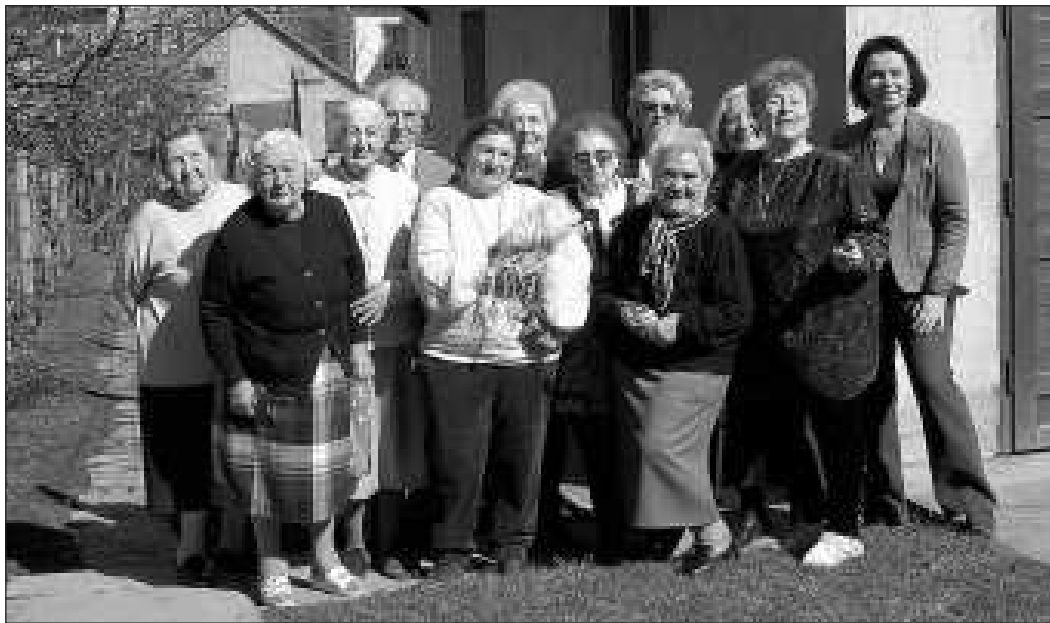
A vendiákok a deákvári kertben. A hatvanadikon is találkozni szeretnének - fogadkoztak a búcsúzaskor a messziről jött osztálytársak

Különleges társaság gyülekezett Vácon, egy deákvári házban. A budapesti, VII. kerületi Állami Kisdédóvóképző Intézet 1951-ben végzett tanulóinak érettségi találkozóját tartották március 14-én.