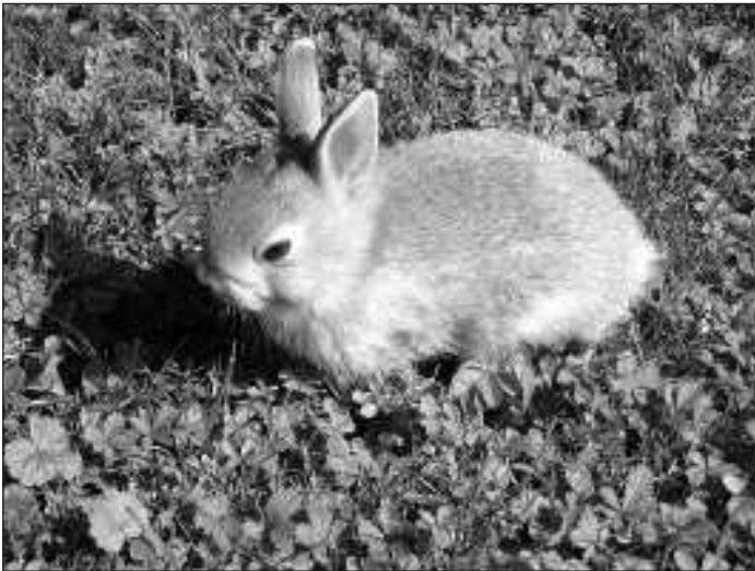
A nyuszik törődést igényelnek, de nem csak Húsvétkor

Az ünnepek után az Orpheus Állatvédő Egyesület