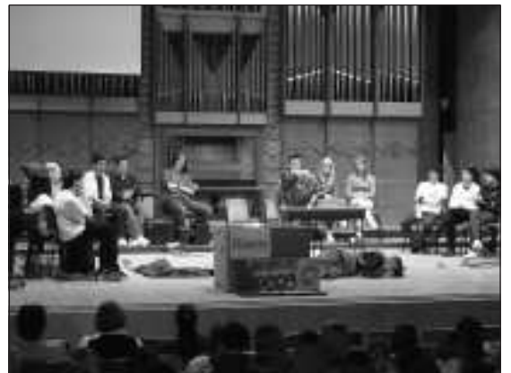
Előadásokat tartottak. Képünkön a cseh diákcsoport bemutatója

Az I. Géza Király Közgazdasági Szakközépiskola és a Karacs Teréz Kollégium a Comenius iskolai együttműködési pályázaton vett részt hat országgal - Ausztriával, Csehországgal, Észtországgal, Izlanddal, Svédországgal, Spanyolországgal - együttműködve és megnyerte a közös projektsorozat megrendezésének lehetőségét. Ennek megvalósításaként a múlt hét pénteken a hat országból érkező diákok tarottak találkozót, melynek a legfontosabb eseményére a Bartók Béla Zeneiskolában került sor. Itt a résztvevő fiatalok 5-10 perces előadásokban mutatták be országaikat.