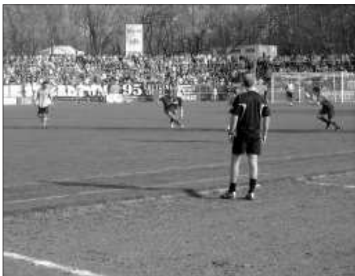
Jászberény és az FTC csapata Vácott játszott