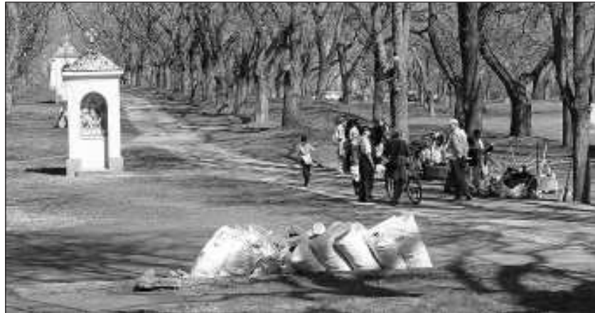
Az elmúlt szombaton takarítottak. Akkor még minden rendben volt...

Másnap, amikor kerestem a felelősöket, telefon telefont követet. Senki nem vállalta fel. Mosolyogva