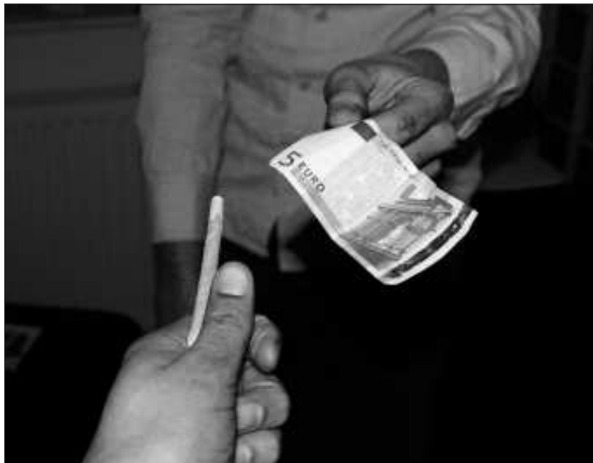
A megkérdezettektől az is kiderült, hogy az első használat átlagéletkora 16,1 év volt

Az illegális drogok közül a kannabisz-származékokhoz való hozzáférés Vácán, minden második megkérdezett szerint megoldható vagy könnyű feladat, illetve, hogy az életkor előrehaladtával egyes anyagok beszerzése könnyebb. A vártnál magasabb arányban jelölték meg a beszerzés helyszínül a diszkók, bulik mellett az iskolákat.