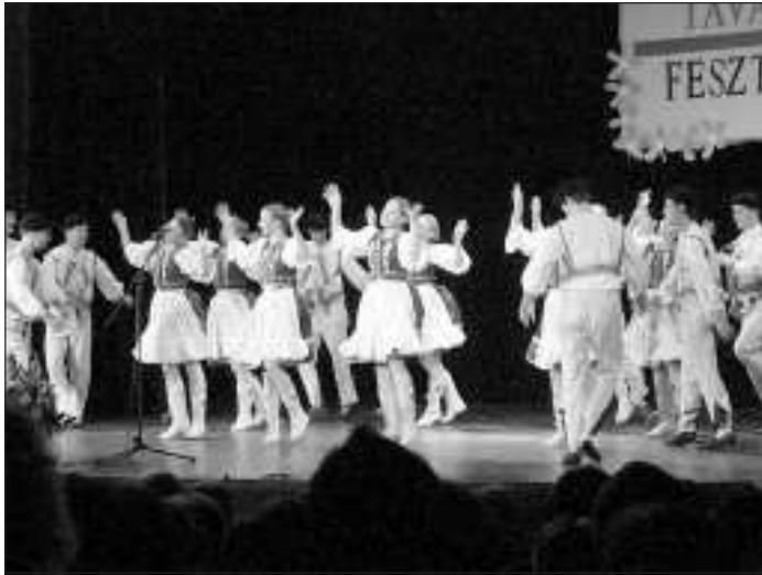
Pörögtek a szoknyák. Az együttes számos díjat nyert már

- Ha Besztercebányán járnak, látogassanak el hozzánk is, hiszen 10 kilométerre fekszik Lupca onnan. Szívesen megmutatom bárkinek a várost - mondta. Az élőzenével kísért néptánc és népdal est ismét nagy sikert aratott. A Partizan tradíci-