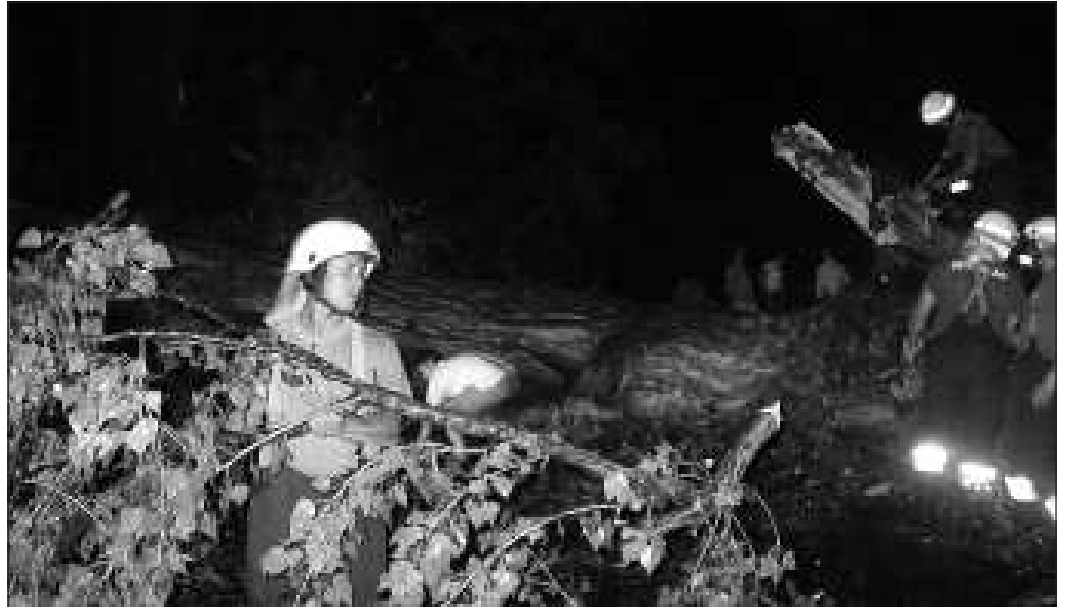
Tavaly kevesebb kárt okoztak a viharok. Vajon idén is így lesz?

egy határmenti gyakorlatra is, amelyen a szlovák tűzoltó egység mellett több társszerv is részt vett. Ezen egy feltételezett komplex eseményt (baleset, személymentés, tűz, veszélyes anyag) kellett felszámolniuk a résztvevőknek.