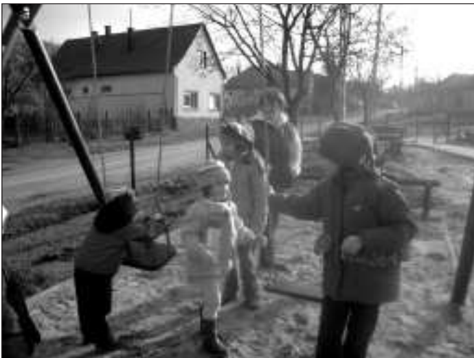
Ez az egy van. A gyerekek boldogan vették birtokukba az új játszótérteret

A felépült, európai uniós normáknak megfelelő játszótér kivitelezésének teljes költsége 8,8 millió forint volt. A településnek eddig is egy játszótére volt. A régit teljesen lebontták és a helyére épült fel az új,