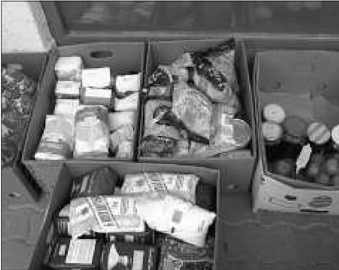
Nem csak a tartós élelmiszerek gyűltek

Nem az első ilyen sikeres akciója volt ez a pártnak, de az utolsó sem. Legutóbb tavaly decemberében, majd idén szeptemberben is volt hasonló rendezvényük. A következőt pedig jövő tavaszra tervezik. A Deák-