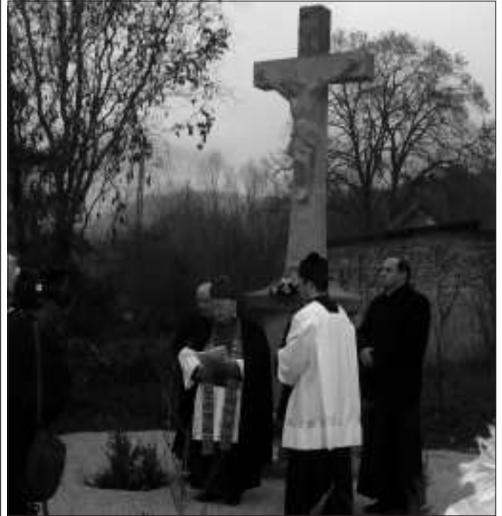
A kereszt. A hegyek is hozzánk tartoznak, a mi hegyeink