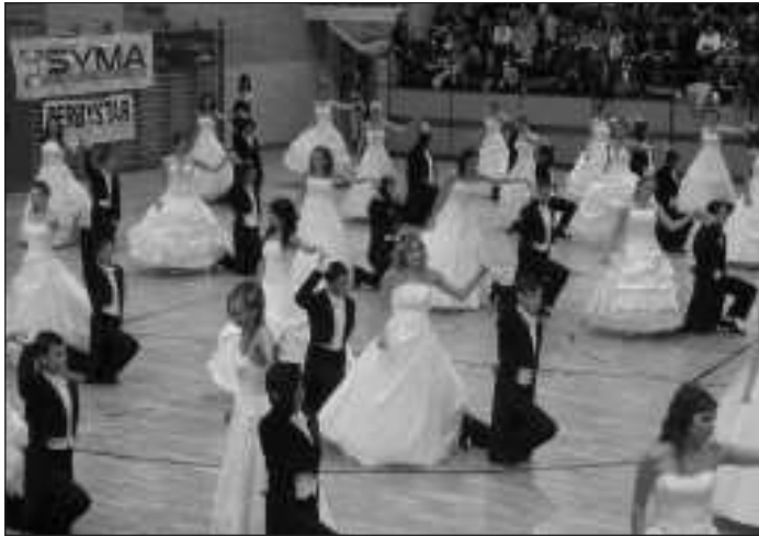
A végzős diákok osztatlan sikert arattak bécsi keringőjükkel

Ezt követte a bál egyik legfontosabb pillanata, amikor is az osz-