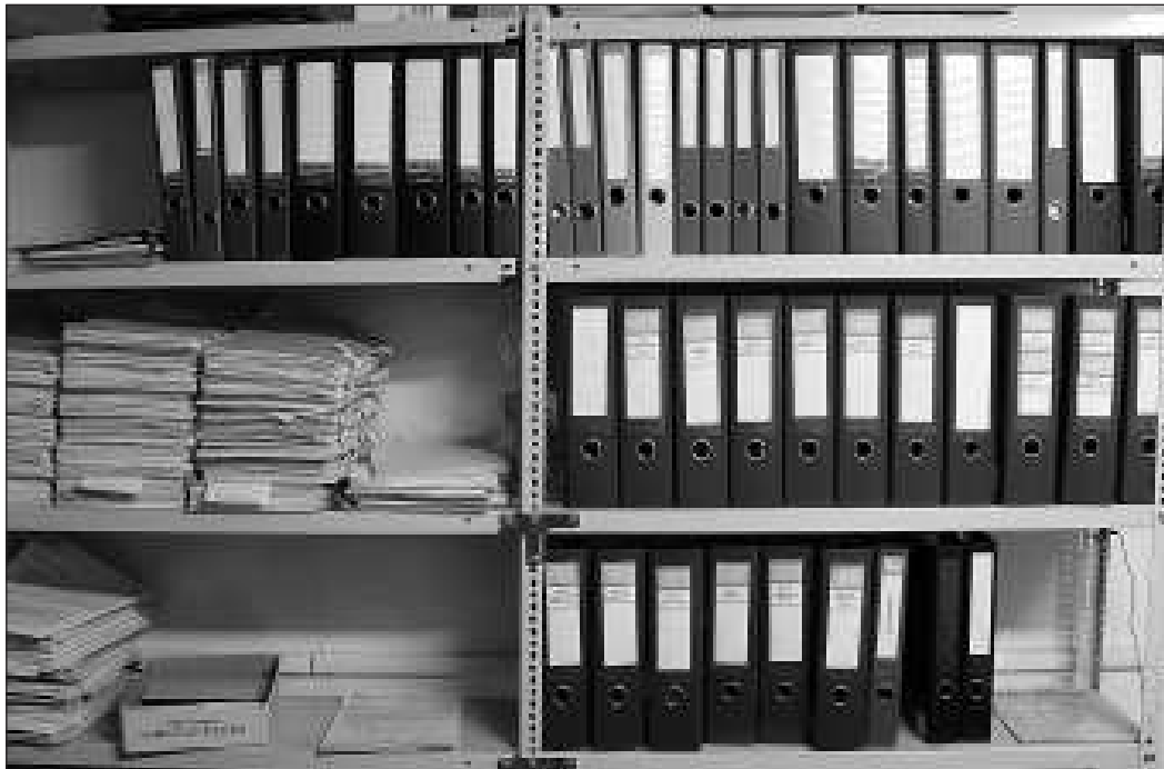
... és ilyen lett az új elnök munkába állása után. Nem csak a szekrényekben kellene rendet csinálni!

A 2009. év nagy kérdése, hogy miből fizetjük ki mindent? A válasz nem egyszerű, s bevallom, egyelőre még magam se tudom pontosan. Volt idő, amikor azt hittem, hogy tudom. Aztán a karácsony előtti napokban a Zöldfa utca 36. szám pincéjében négykézláb mászkálva láttam a fűtés-csővek állapotát. Újév után pár nappal, ugyanott, a 26-os szám tetején dolgoztam a tetőszigetelővel, láttam a megbontott tetőt. Hát az megérne egy külön misét! A volt elnök alig több, mint öt éve újította fel, szavatosság már nincs rá. De beázik. Ott is, a 32-ben is, a Nagymező utcában is. A kivitelezés csapnivaló. Ha nem nyúltak volna hozzá, talán most jobb lenne, de legalábbis a pénz megmaradt volna.