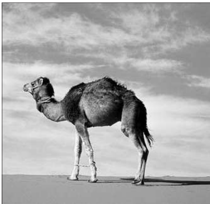
Teve a sivatagban. Futni is lehet vele

A parádé alkalmával interjút adtam a helyi rádióknak és újságoknak, így az elkövetkező napokban már mindenki ismert és integetett, ha meglátta a matricákkal teleaggatott fura fazont futkározni a sivatagban. Délután újra futottam a környéken, de csak az ENSZ bázisig és vissza róttam az utat, szigorúan a keréknyomban. Nagyon kellett vigyázni, hogy a kitaposott úton maradjak, mert az út két oldala teljesen el van aknásítva. Színesre festett kövek őrzik az aknamezőn elhunytak emlékét, szívfacsaró volt látni az egyik kőre kötözött gyerekcipőt, de láttunk kilőtt tankokat, lövés-