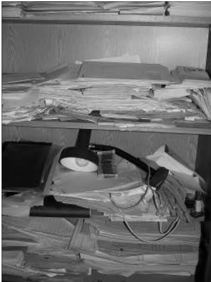
Ilyen volt a régi rend az irodai szekrényekben...

A szövetkezetet megropant, kifosztott állapotban találtam. Az átvételt megelőző könyvvizsgálat mintegy 5 millió forint ki nem fizetett tartozást mutatott ki, ami nagyrészt kifizetetlen közüzemi díjakból állt. Ezek fizetése még szeptemberben és október elején is nehézségekbe ütközött, mert a volt elnök a bankszámlán alig hagyott