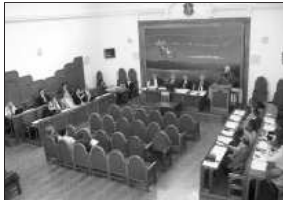
Üléseztek a képviselők. Volt néhány beszólás és sok egyhangú szavazás