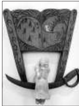
Útő Endre munkája

Kiállítás a Credo-házban. Kerámia és szobor kiállítás nyílik a Credo-házban október 25-én, szombaton 16