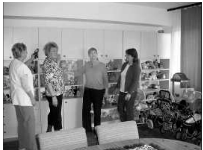
Hatodszor segítettek a váci iskolának

sérült diákjai számára. A bank dolgozói számára nem újdonság az önkéntes segítségnyújtás, hiszen már hatodik alkalommal vettek részt az oktatási intézmény környezetének