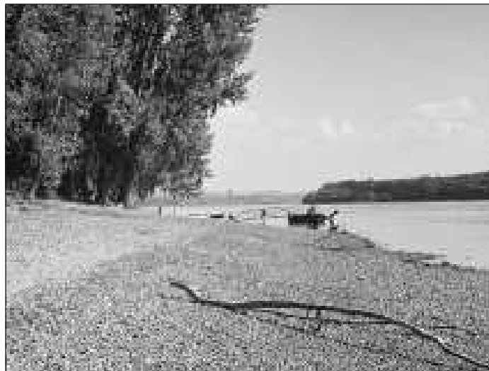
A Duna, a mi életető folyóink. Ma már fokozott védelemre szorulnak a vízbázisok

Emlékezünk és köszönünk. A mindennapok munká-