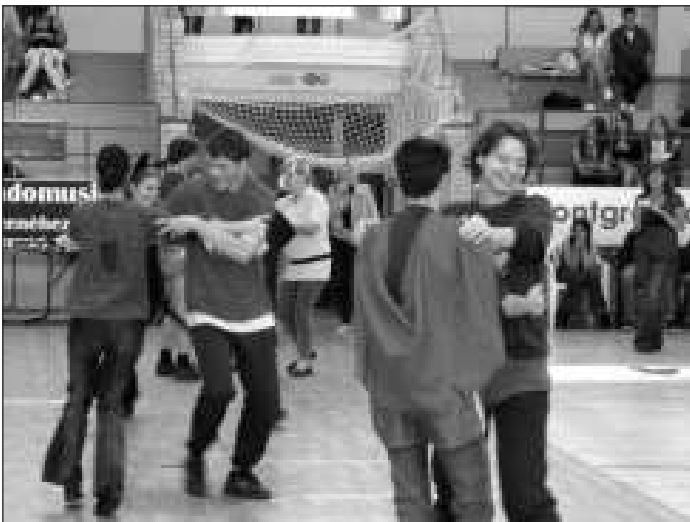
A táncos produkciók nagy szerepet kaptak a szecskaavatón