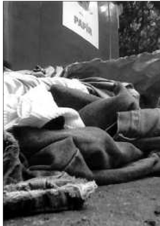
A fotópályázat első helyezett képe