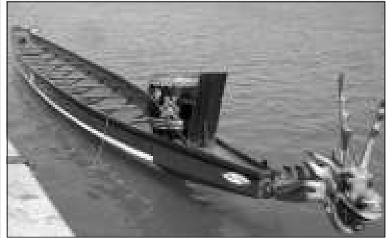
Igy néz ki egy sárkányhajó