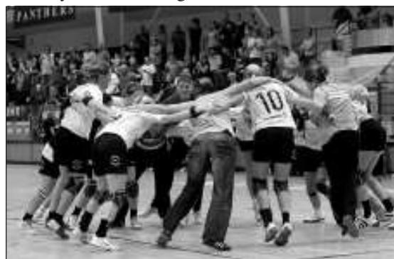
A dudaszó pillanata, váci karok a magasban

az asztalon tartjuk. Úgy gondolom, a csapat tagjai felnőtt emberek, profik, akiknek minden körülmények között a leg-