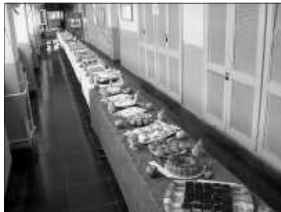
A nap gasztronómiai koronáját minden bizonnyal az almás-sütemények kóstolója, versenye jelentette

A egyszerű kiállításról és a rendezvény zökkenőmentes lebonyolításáról településünk két intézményének pedagógusai, alkalmazottai gondoskodtak. Az óvodai munkatársai sok-sok töklámpással díszítették a művelődési ház előterében létrehozott kiállítást. Iskolánk pedagógusai és dolgozói mindent elkövettek az előkészületek és a napi programok során, hogy Szob hírnevét az idelátogatók magukkal vigyék,