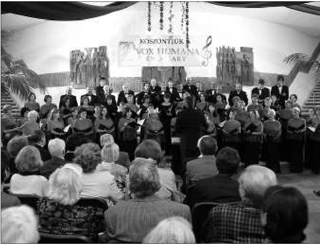
A hetven éves Vos Humana Kórus. Köszöntötték a legrégebbi tagokat is

Vasárnap este olyan sokan gyűltek össze a Vox Humana Enekkar hetvenedik születésnapján ünnepségére a művelődési központ aulájában, hogy sokaknak már csak állóhely jutott. Ezen az eseten a résztvevők egy olyan helyen voltak, ahol a terem belengte az ünnepélyesség, az egymás és a zene iránti szeretet. Jó volt ott lenni.