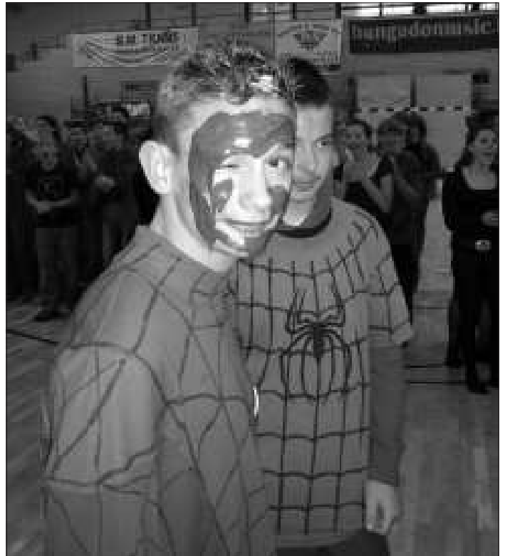
Mogyorókrémes arcról nem könnyű kanállal megenni ezt finomságot

Mielőtt leszakadna az ég, térjünk vissza a megmérettetésekhez, amelyekben két feladat erejéig a csokoládé kapta a főszerepet. Először kéz használata nélkül kellett pelenkából csokitortát enni (hozzáteszem, nagyon finom torta volt), majd egy mogyorókrémmel összekevert arcról kanállal leszedni a finomságot. Ezek után nem maradhatott el a klasszikus lányfiú átváltozás sem: minden osztályból egy ember esett áldozat-