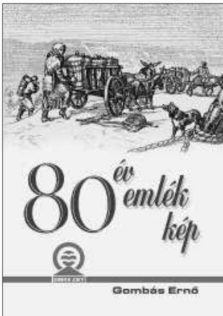
Az ünnepségen mutatják be az emlékkönyvet

gondoljunk csak jó néhány helyrehozhatatlanul hibás döntésre, amelyekben a szakma helyett rendre a szakmán felüli (aluli) világ pozíciós és presztízis okai döntöttek.