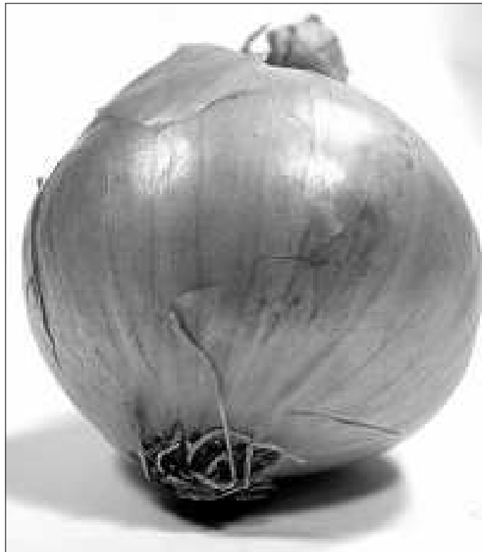
A vöröshagyma bizonyítottan csökkenti az érlemeszeseést, és szívroham rizikóját

· Vöröshagyma: tavasszal, március vége felé vásároljunk