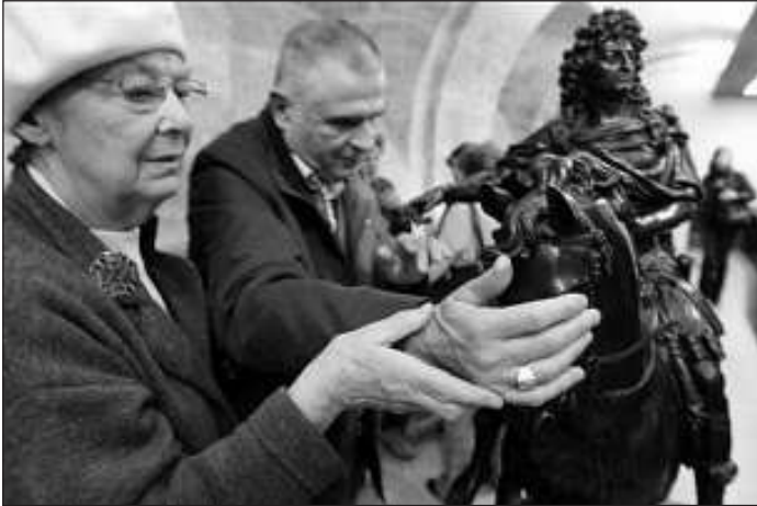
Egy sötétszoba segítségével az érdeklődők megtapasztalhatják milyen nehéz látás nélkül élni (a kép illusztráció)

A Tapintható világ kiállítása október 16-17-én és 20-21-én 10-től 15 óráig tekinthető meg. Kérik, hogy a várhatóan