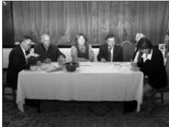
A zsűrinek nehéz feladata volt a kiértékelésnél

nyen az 5. osztályosoktól a 8. osztályosig vehettek részt városunk első, ilyen témájú vetélkedőjén.