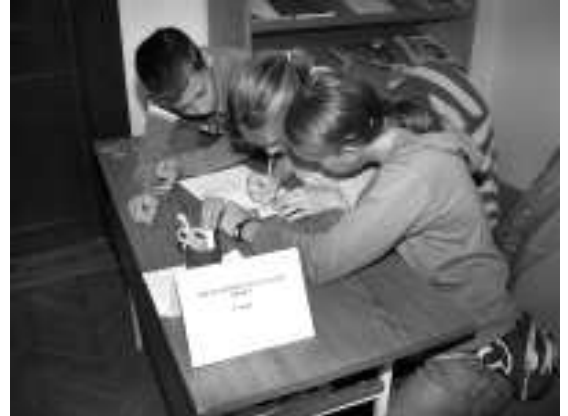
A résztvevő gyerekek jókedvvel végezték a komoly feladatokat

A zsűri keményen dolgozott a kiértékelésnél és a pontszámok összesítésével, mivel a mezőny igen szoros volt! Kis zavar támadt a fotók díjazásánál, mivel a munkák jellegűek voltak, és nem minden alkotó tudott jelen lenni. Az I. díjat a Szappan című fotós kapta, de csak iskolájának taná-