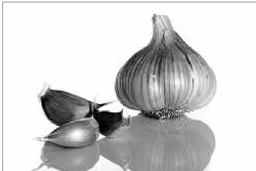
A fokhagyma az immunrendszert is serkenti

tása miatt adjuk bab és káposzta ételekhez.