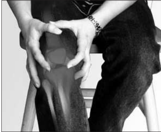
Érdemesebb a térdízületi fájdalom csillapítására inkább a helyi NSAID kezelést választani

A nem szteroid gyulladásgátlók (NSAID) alkalmazása széles körben elterjedt a krónikus térdízületi fájdalom kezelésében. Angol orvosok felvetették, amennyiben az NSAID helyi alkalmazása is ugyanolyan eredményes, mint a szájon át szedett gyógyszer, érdemes az előbbihez folyamodni - olvasható az informed.hu internetes portálon.