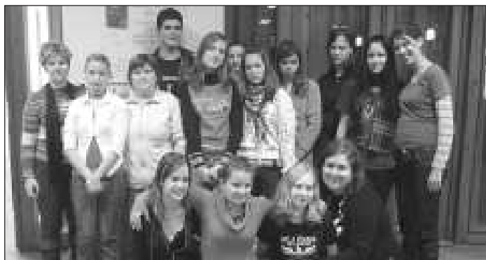
Az iskola tanulói a család témakört dolgozták fel

A záró rendezvényre a Madách Imre Művelődési Központban került sor december 11-én, nagyszabású esemény keretében, amelyen mind az öt középiskola bemutatta produkcióját, ami egy kreatív ver-