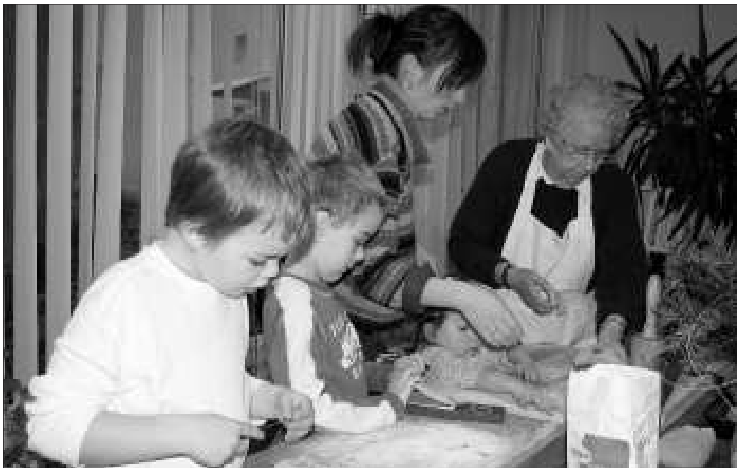
A mézesbábot lisztből, mézből és cukorszirupból készítették kicsik és nagyok

Elkészítése: szirupot készítünk a mézből, cukorból, margarinból és a vízből. Egy tálban összekeverjük a lisztet, szódbikarbónát, fűszereket és ehhez hozzáadjuk a már langyos mézes keverékünket. A tojást csak a legvégén dolgozzuk el benne, ha már biztosan nem meleg a tészta. Az illatos mézeskalács tésztánkat csomagoljuk be fóliába és tegyük a hűtőbe pihenni. A legjobb, ha napokig, de minimum két órát pihenjen. A hűtőből kivéve 1-2 mm-esre nyújtjuk, és ünnepi formáinkkal kiszaggatjuk. 180 fokos sütőben kb. 10-12 percig sütjük. A díszítéshez cukormázát készítünk. Összekeverjük a tojásfehérjét a 10 dkg cukor-