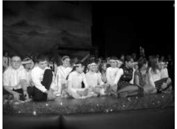
Sok fényes csillagocska volt itt színpadon, csodálatos melegség járta át a szíveket

egy csodálatos estét szereztek a közönségnek. Én azt gondolom, ha a legidősebb pásztor szavai teljesülnek, hogy teljes szíve melegeivel köszönti a kis Jézust, köszönti azokat, akik ebben a szép estébe Jézus születésének napján részesülhetnek, akkor ezek a szavak nekünk is szóltak itt. S én azt látom, nagyon sok fényes csillagocska volt itt színpadon, csodálatos melegség járta át a szíveket - az enyém biztos, de azt gondolom, másokét is - és nemcsak hogy megtiszteltetés számomra, hogy ennek az eseménynek a fővédnöke lehettem, hanem nagyon-nagyon öröm is - hallottuk dr. Muszbek Katalintól.