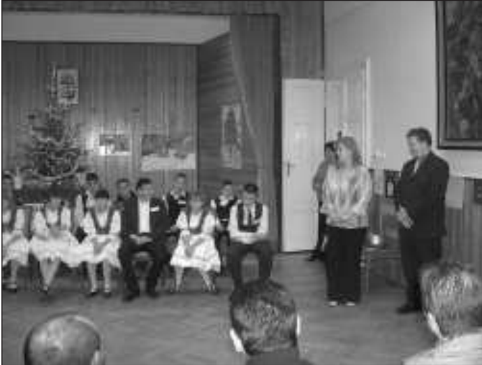
A fogvatartottak csaknem 200 ezer forintot gyűjtöttek össze a váci iskola halmozottan hátrányos helyzetű árva lakói számára

ahol az új játékok vártak arra, hogy birtokba vegyék a gyerekek. Ezután gyerekek és felnőttek közösen kicsomagolták a játékokat, majd örömmel fogyasztották a süteményt és a teát. A meghitt ünnepség végén még egy karácsonyi dal közös eléneklése után integetve, könnyes szemmel búcsúzó-