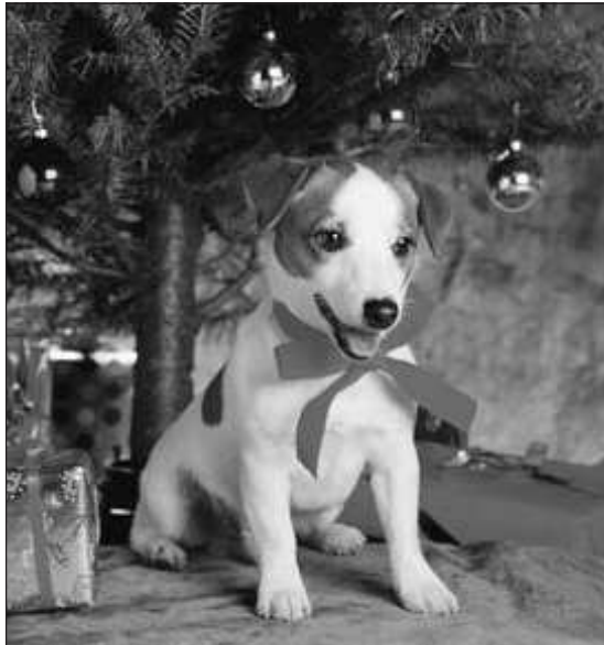
Az ünnep utáni szürke hétköznapokban az állatok sokak számára csak nyűg lesz

Nem ritka, hogy az ajándékba kapott, de megunt díszhalakat (még élve) egyszerűen a wc-ben leengedik. Az apró rágcsálókat, teknősöket, vadászgö-