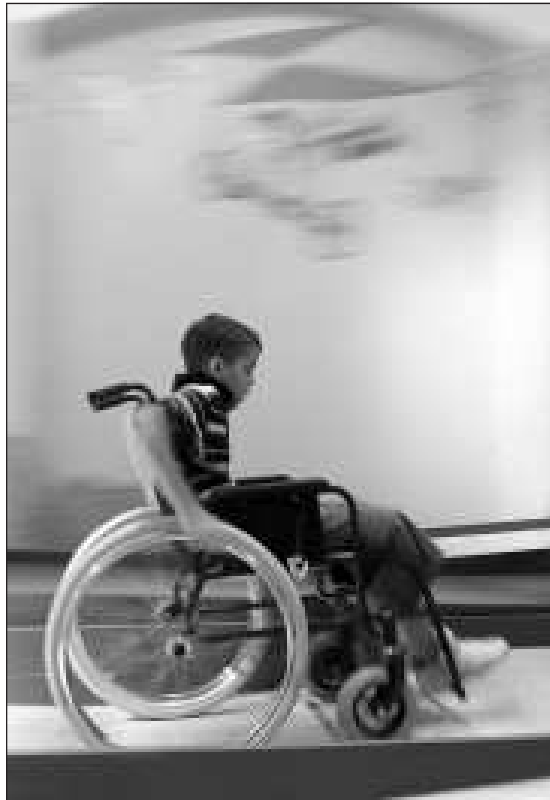
Az Ability Parkban átélheti az ember, hogy milyen lenne, ha így élnénk életünket...

A feladatokat többé-kevésbé jól megoldottuk, persze mindig tapasztalva, hogy milyen fogyatékosok vagyunk, ha nem látunk,