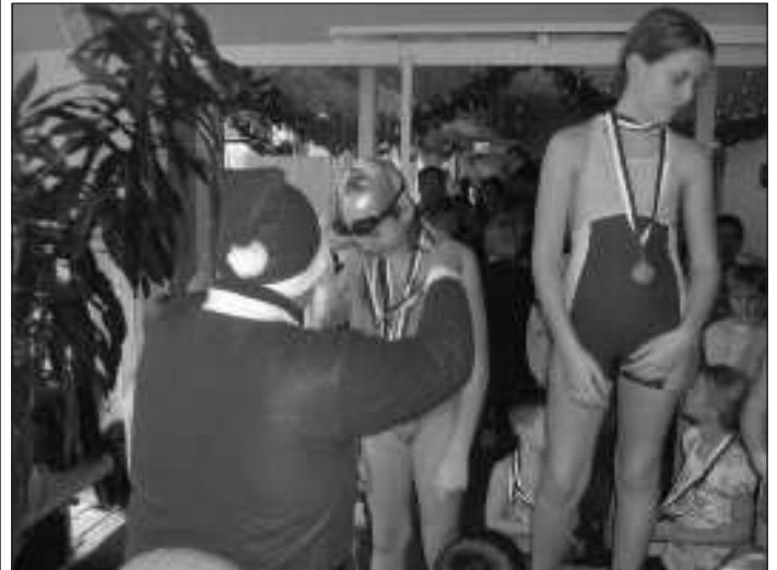
A gyerekek nagyon várták nem csak a mikulást, de a versenyt is

verseny. S ha már rávették az elnökséget a megrendezésre több szülő a zsebébe nyúlt, hogy a hiányzó összeget összedobja. Mert ugye a gyerekek nagyon várták nem csak a mikulást, de a versenyt is.