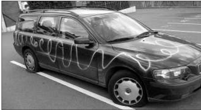
A vandál cselekedet kapcsán szinte azonnal felmerültek kérdések, amelyekre egyelőre nincs válasz (képünk illusztráció)

Vajon miért történt mindez? Ha végiggondoljuk, alapvetően két eset lehetséges. Az egyik variáns ebből, hogy ez a cselekedet pusztán egy spontán rongálás volt. Képzelnék el, hogy tettesünk - az egyszerűség kedvéért tételezzük fel, hogy csak egy ilyen korlátozott kóvályog a környéken - csütörtök reggel felkel és azt mondja: - De **r napom van. A múlt héten sem az én számat húzták ki a lottón, tele van a szervezetem a héttel. Megyek és megrongálok valamit. Mondjunk egy kocsi. De nem egyszerűen betöröm az ablakát. Áh, amatőr gondolat. Nem. Magamhoz veszek néhány liter kromofágot, bicskát meg csavarhúzókat és olyat teszek az autóval, hogy a performansz-mű-