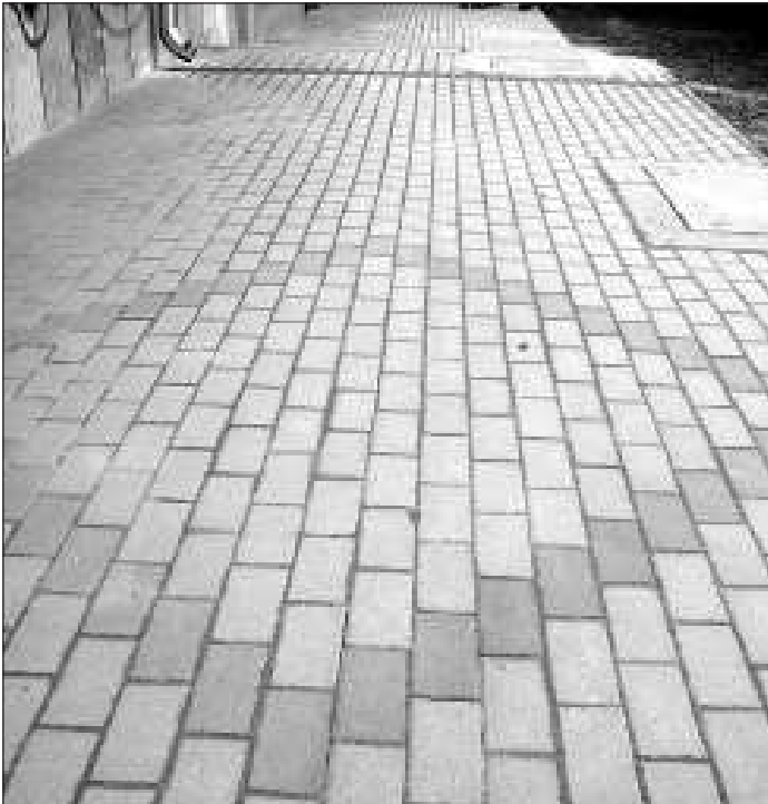
A megszépült burkolat. Ez a burkolat lehetővé teszi a lokalizált javítást