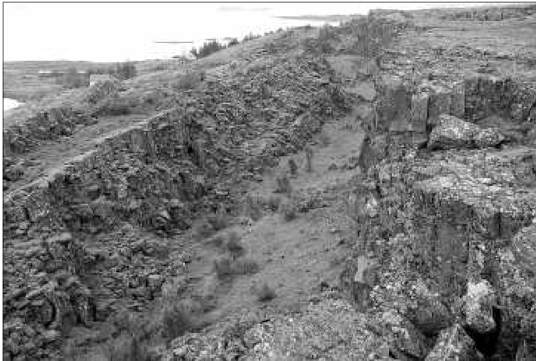
A meghasadt föld

Az Izlandi Nemzeti Múzeum, és a lélegzetállítóan szép, modern katedrális meg-