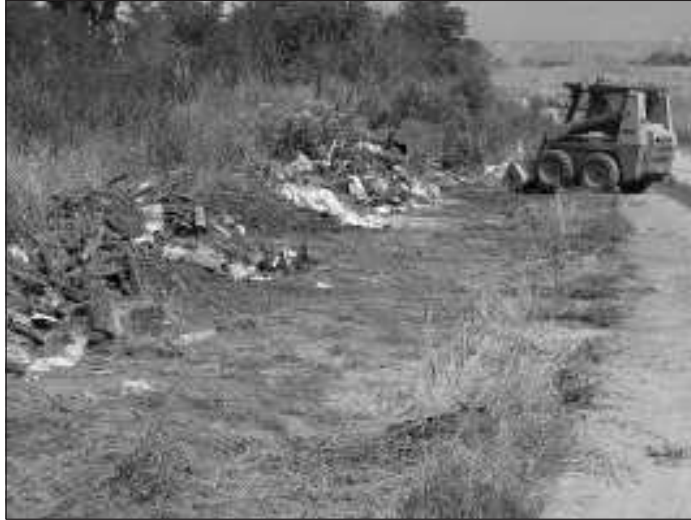
Václiget 2007-ben. Összesen 400 tonna illegális hulladékot szállítottak el a város három területéről