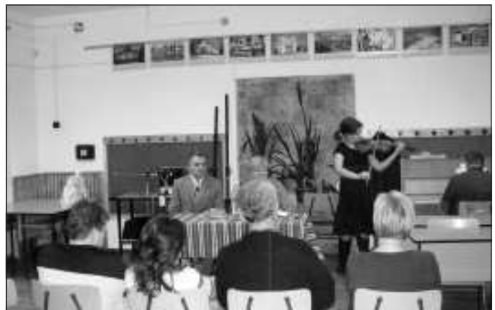
A szervezet a kultúrát is támogatja

az önkormányzat által meghirdetett Földvály emlékévi programjaihoz. Fontosnak tekintik a lakótelepi városrész fejlesztését, a parkok, játszóterek, az utak, a járdák, a közterületek felújítását, de legalább ennyire lényegesnek tartják a meglévő értékek megőrzését is. Éppen ezért 2009-ben