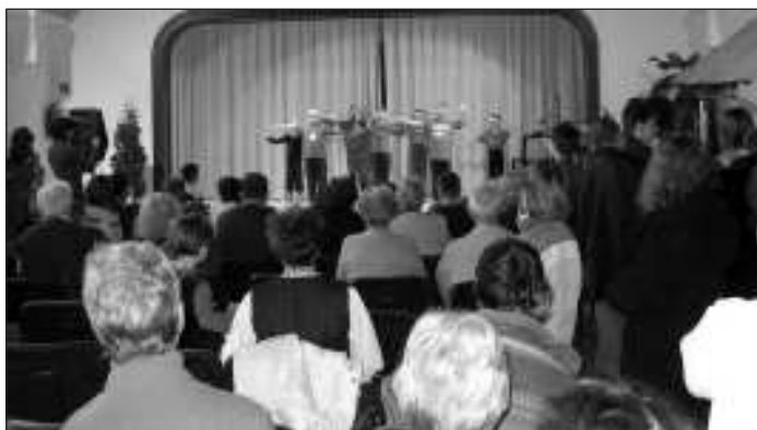
A táncosok mindenkit elkápráztattak